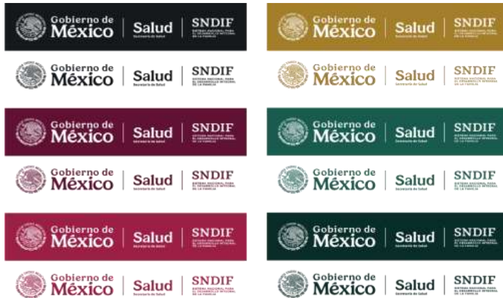
Pantones permitidos. Guía de Identidad Gráfica 2024-2030. Gobierno de México

Está prohibido el uso a una tinta para salida en medios digitales o en impresiones de cuatricomía.