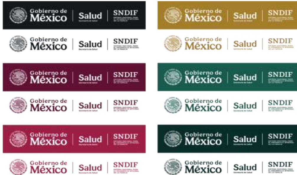
Pantones permitidos. Guía de Identidad Gráfica 2024-2030. Gobierno de México

Está prohibido el uso a una tinta para salida en medios digitales o en impresiones de cuatricomía.