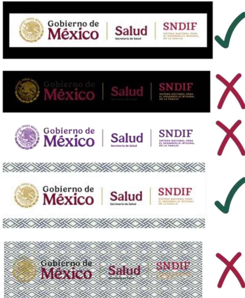
Ejemplos de aplicaciones cromáticas (correctas e incorrectas)