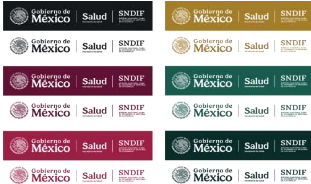
Pantones permitidos. Guía de Identidad Gráfica 2024-2030. Gobierno de México

Está prohibido el uso a una tinta para salida en medios digitales o en impresiones de cuatricomía.