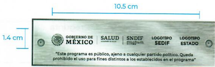
Placa metálica grabada en láser