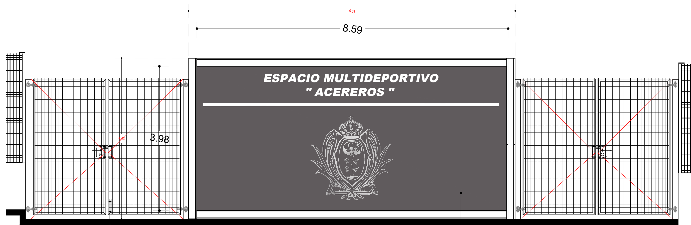
ALZADO FRONTAL ACCESO "ACEREROS"